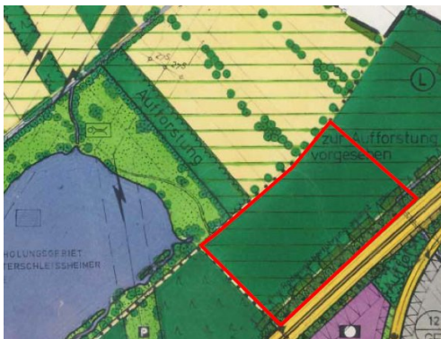
Rechtsverbindlicher Flächennutzungsplan in der Fassung vom 03.06.1991

Hinsichtlich der landesplanerischen Vorgaben ist nach Auskunft der Höheren Landesplanungsbehörde (HöLaPla) kein Raumordnungsverfahren notwendig. Der Anlage werden aufgrund ihrer Größe und Funktion keine besonderen überörtlichen Auswirkungen beigemessen, die nicht im Rahmen der Bauleitplanung geregelt werden könnten.