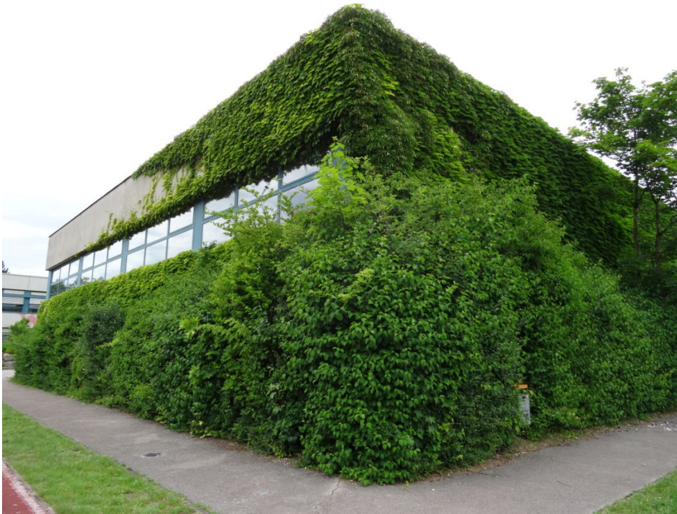
Abbildung 7: Bestandsgebäude der Michael-Ende-Schule mit Fassadenbegrünung aus Wildem Wein. Blick von Südosten.