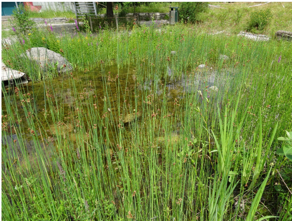
Abbildung 14: Teich im Schulgarten.