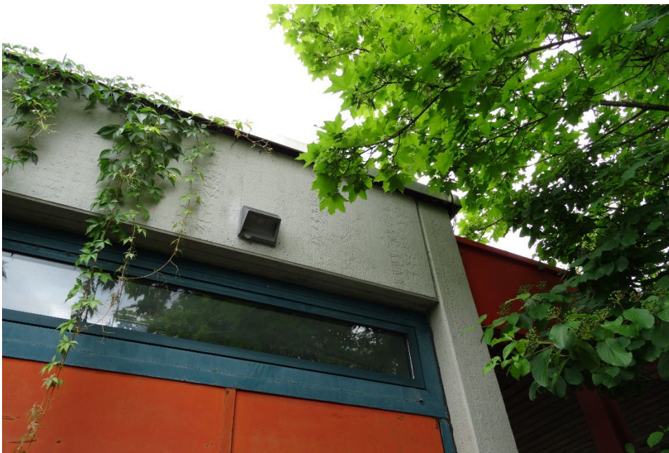
Abbildung 8: Überstand des Blechdachs am Gebäude; potentielle Einschluþmöglichkeit für Fledermäuse.