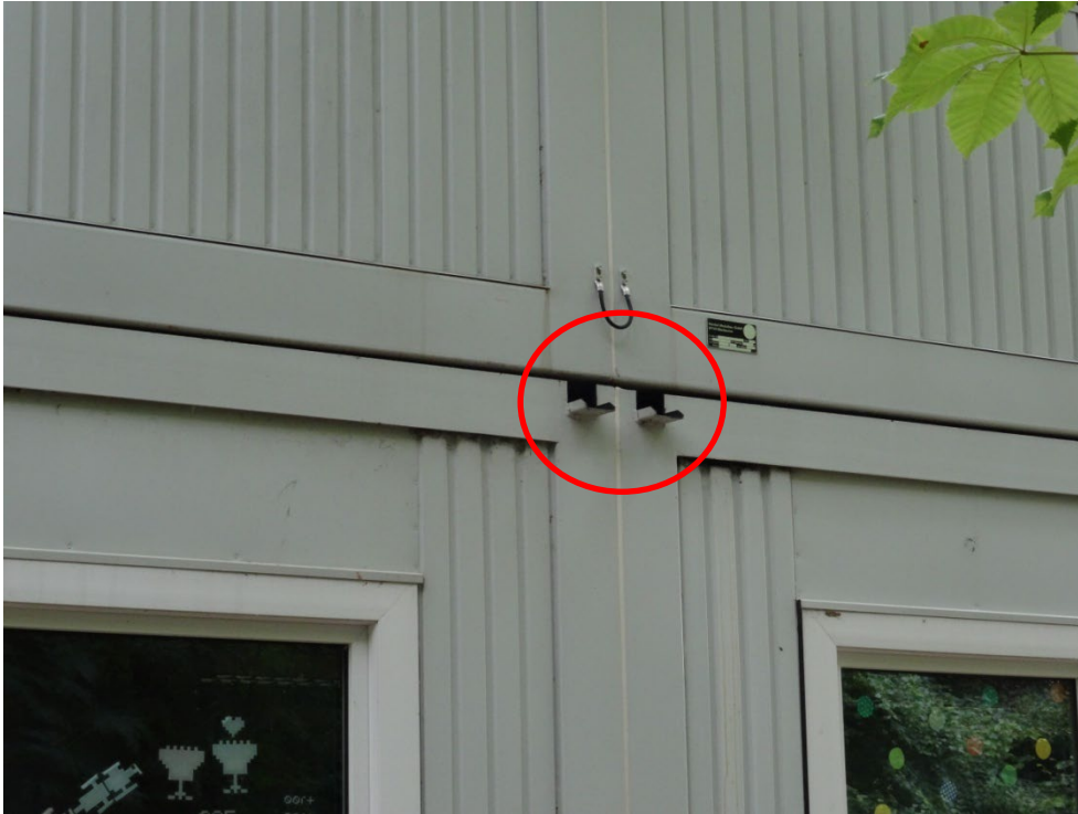
Abbildung 5: Potentielle Einflugmöglichkeit für Haussperlinge an den Containern.