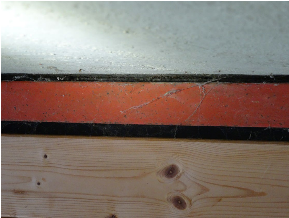
Abbildung 11: Potentielle Einflugmöglichkeit für Fledermäuse am Dachrand der Fahrradüberdachung.