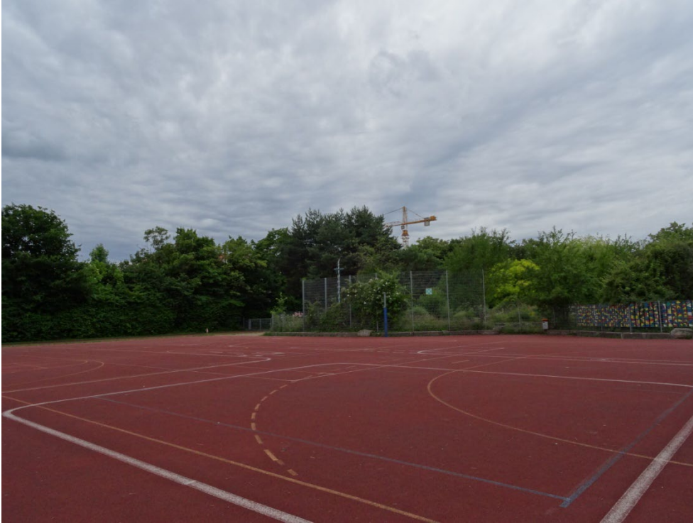
Abbildung 3: Bestehender Sportplatz im Süden des Plangebiets, Blick von Nordosten.