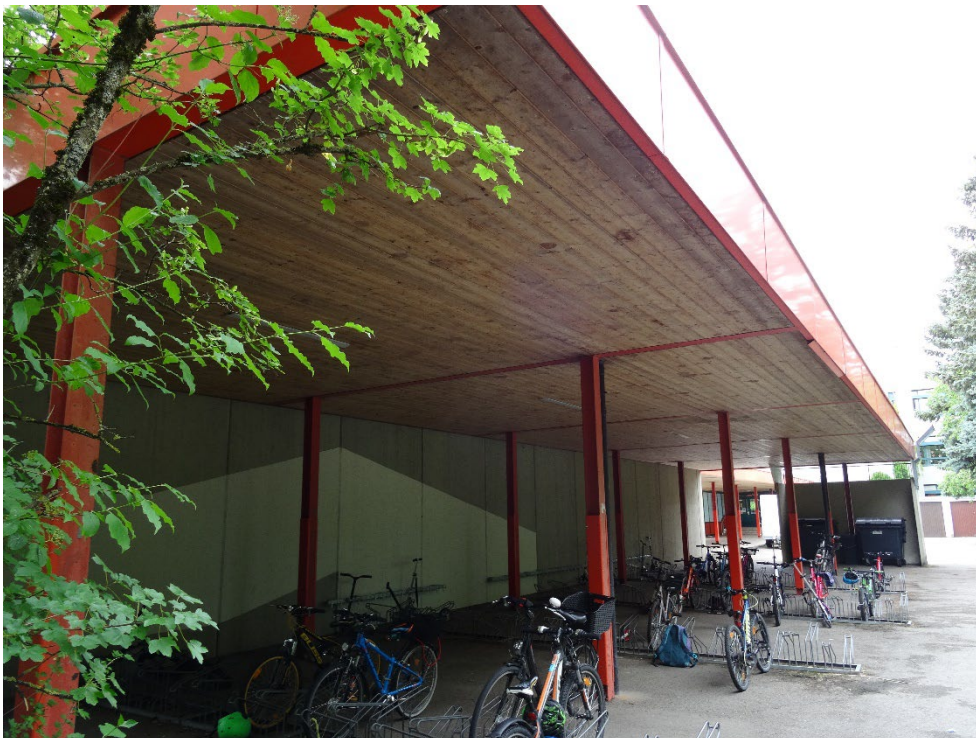
Abbildung 10: Überdachter Fahrradständer im Norden des Gebäudes mit Blech-Dachabschluss und Holzverkleidung