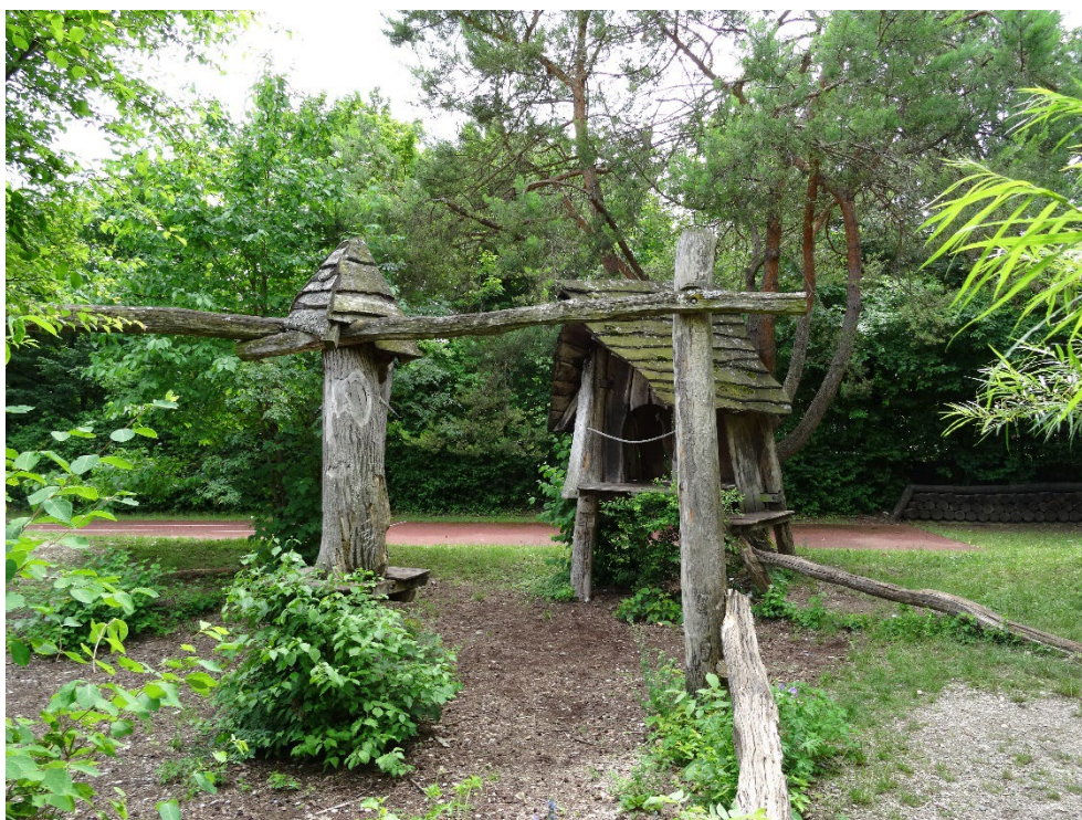
Abbildung 16: Baumhaus im Westen des Plangebiets.