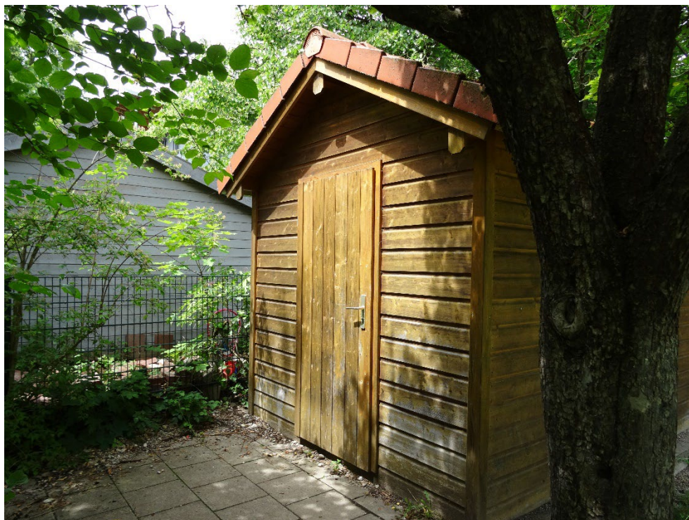
Abbildung 15: Gartenhäuschen im Westen des Plangebiets.