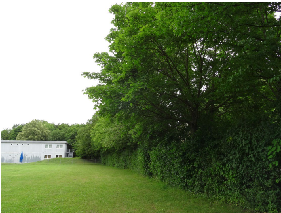
Abbildung 6: Trittrassen mit mittelaltem Gehölzstreifen aus Bäumen und Sträuchern entlang der südöstlichen Plangebietsgrenze und Containern im Hintergrund. Blick von Süden.