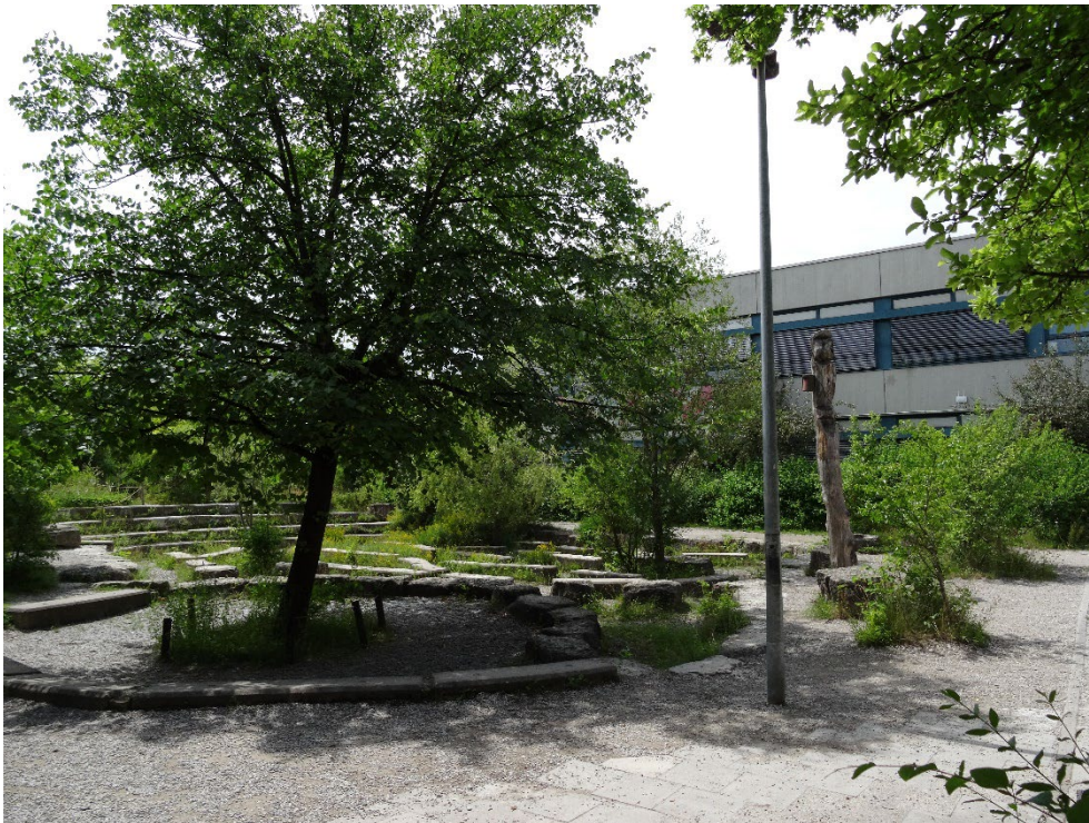
Abbildung 12: Schulgarten im Westen des Plangebiets mit gekiesten Wegen und Sitzstufen.