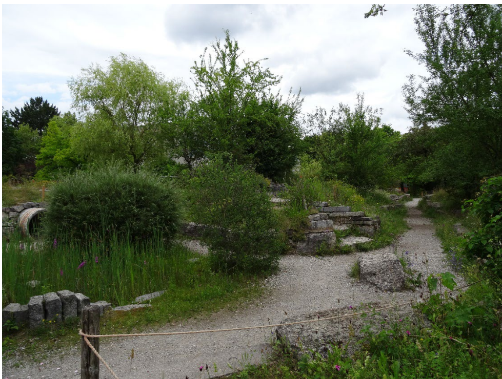
Abbildung 13: Naturnaher Schulgarten im Westen des Plangebiets mit Staudenbeeten und Steinmauern.