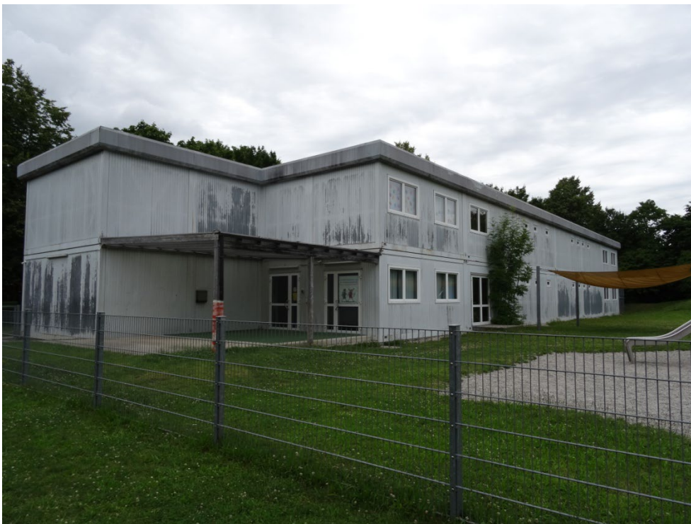
Abbildung 4: Container im Norden des Plangebiets, Blick von Südwesten.