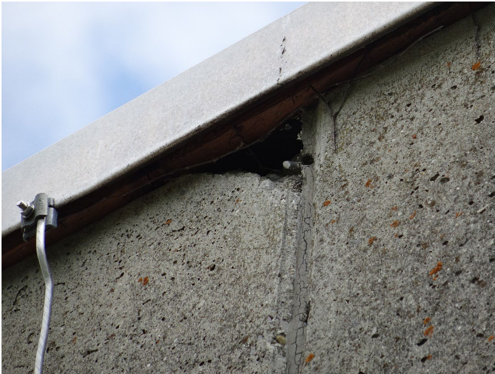
Abbildung 9: Mauerausbruch an der Südfassade des Gebäudes – potentielle Einflugmöglichkeit für gebäudebrütende Vögel und Fledermäuse.