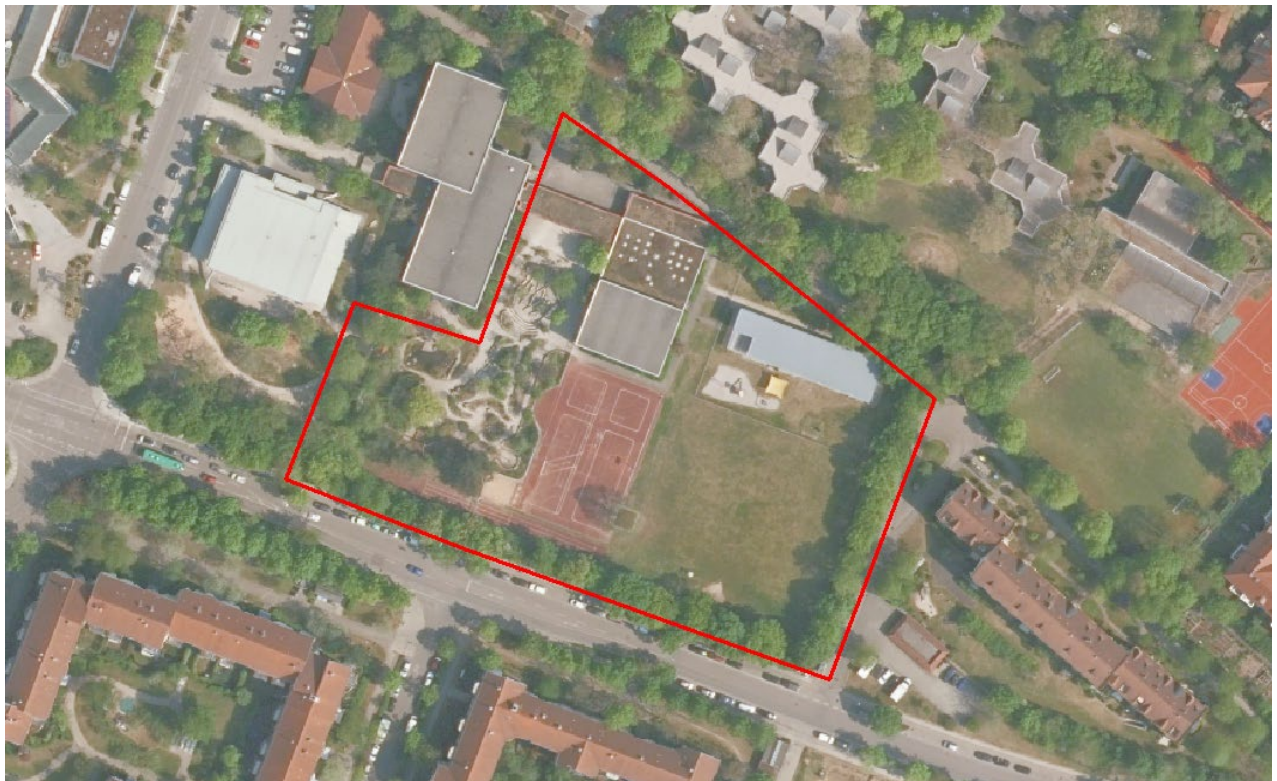
Abbildung 2: Plangebiet (rot umrandet).